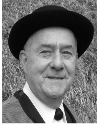
(ergründeten Naturgesetz: Albert Einstein u. Heinrich Stauffacher)

Alle Geschöpfe haben das naturgesetzliche Recht auf ihr Hoheitsgebiet - es ist Grundlage des unbestreitbaren Lebensrechts! Kein Mensch kann gezwungen werden, sich einem politischen Betrieb anzuschliessen - er muss frei wählen können. Demzufolge schuldet er auch keinem System, dem er nicht angehören will, irgendwelche Leistungen, auch nicht für ungebetene (Vor-)Leistungen - abzugelten sind ausschliesslich persönlich genutzte Angebote, entsprechend dem jeweils gemessenen Nutzungs-Umfang.